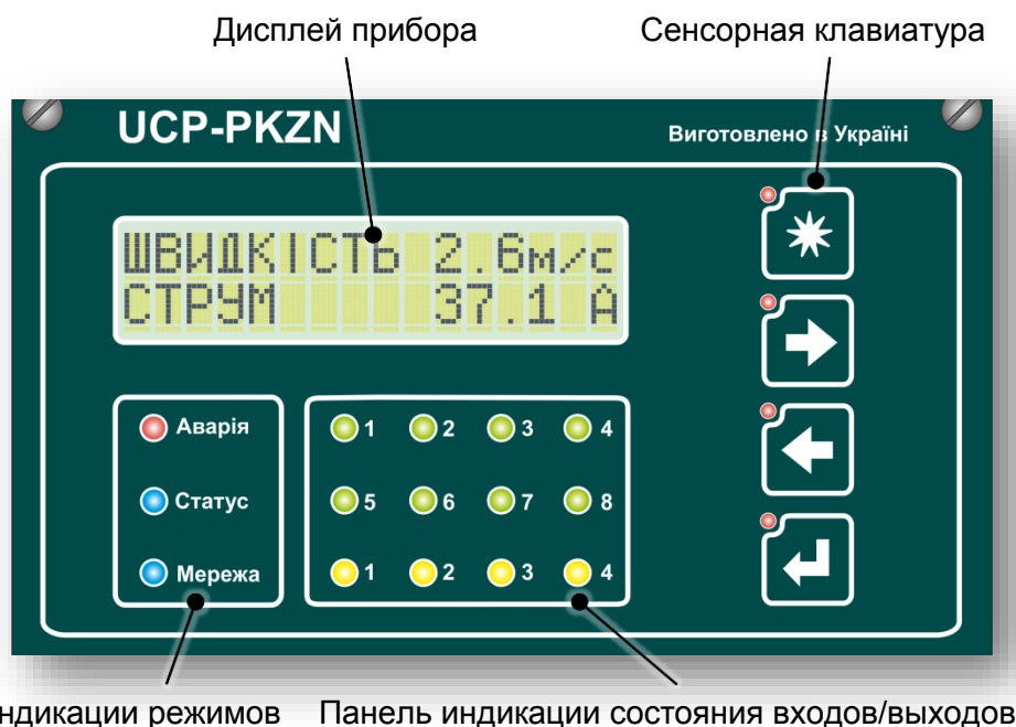
Панель индикации режимов Панель индикации состояния входов/выходов

В варианте комплектации весоизмерительного либо весодозирующего терминала (исполнение UC-VIT) контроллер обеспечивает электрическое питание и прием сигналов весоизмерительных датчиков, отображение на дисплее их значений и режимов работы, управление подающими и отгрузочными задвижками, настройку предельных значений, выдачу аварийного оповещения.